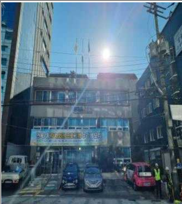
건축 예정지 현장