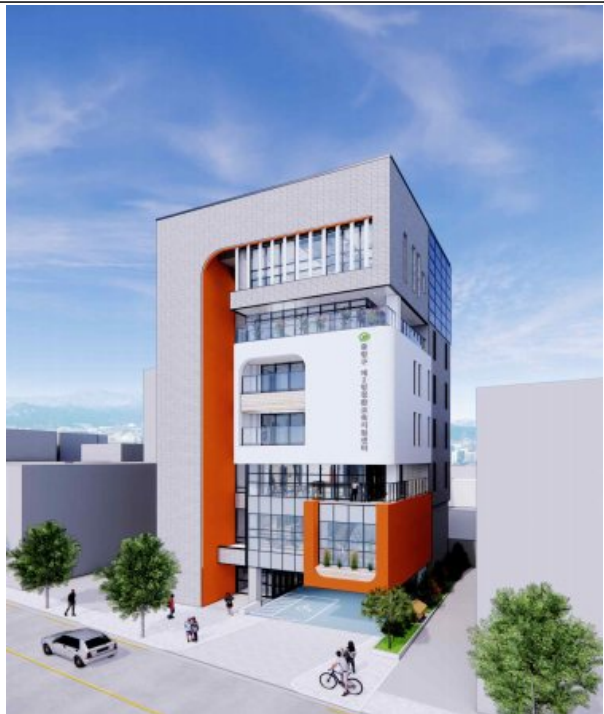
제2방정환 교육지원센터 조감도