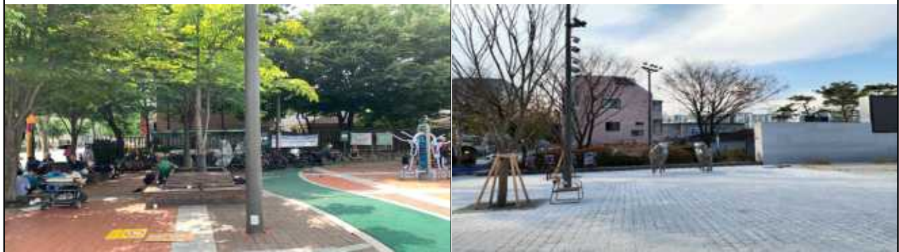
근경 사진(공사 전·후)