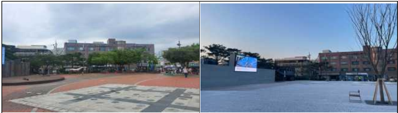
전경 사진(공사 전·후)