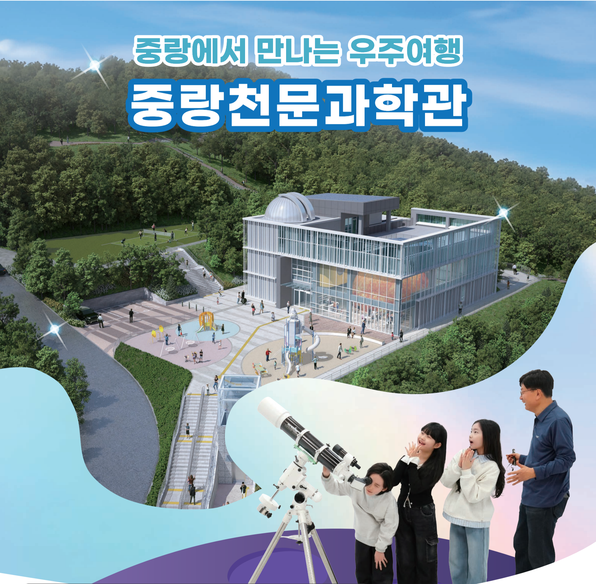
표지이야기 중랑구 용마폭포공원 내 또 하나의 랜드마크 '중랑천문과학관' 3월 착공